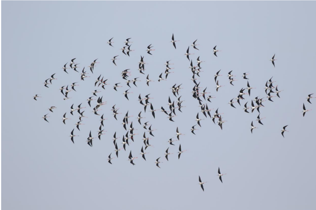
图9 横沙新洲上空鸟类迁徙