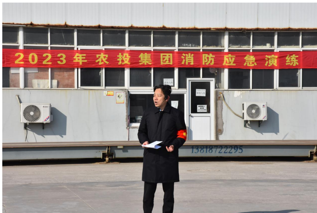
图 7 农投集团消防应急演练

农投集团高度重视安全生产工作，贯彻落实“安全第一、预防为主、综合治理”的方针，农投集团领导严格履责，落实党政同责，建立健全安全生产责任体系，明确各级管理人员和岗位员工的安全生产职责。同时，农投集团加强安全生产教育培训，提高员工的安全意识和安全技能，落实各项安全生产应急预案和应急演练，增强安全生产意识，努力营造安全生产文化氛围，履行国有企业的担当。