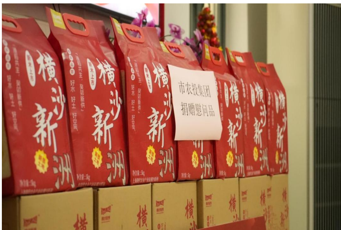
图 11 农投集团向福利院捐赠大米

“养老、敬老、爱老”是中华民族的传统美德，也是农投集团一直秉承的价值观。在坚决贯彻落实市委、市政府工作部署，全力打造世界级现代都市生态绿色农业示范区和新时代中国式现代化农业园区的同时，农投集团也希望能够为社会的养老事业贡献一份力量。通过捐赠新鲜、优质的横沙新洲国庆稻，农投集团希望让福利院的老人们感受到来自社会的温暖和关怀，让他们吃得开心、吃得放心。此次捐赠活动不仅实现了农投集团与上海市第一福利院、虹口区福利院之间的社会责任良性互动，也进一步弘扬了孝善文化，传递了社会正能量。农投集团表示将继续积极追寻党旗下的孝文化，为社会的和谐稳定和发展贡献更多的力量。