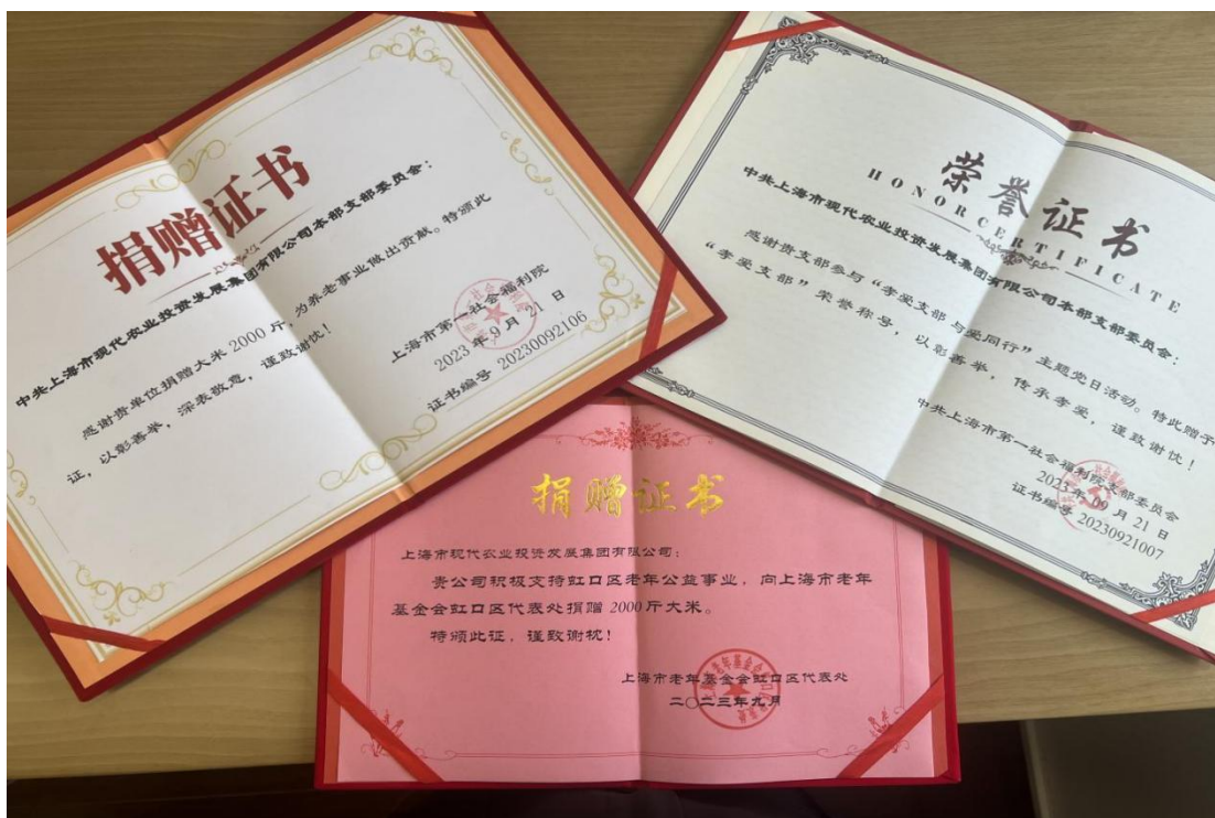
图 13 捐赠证书