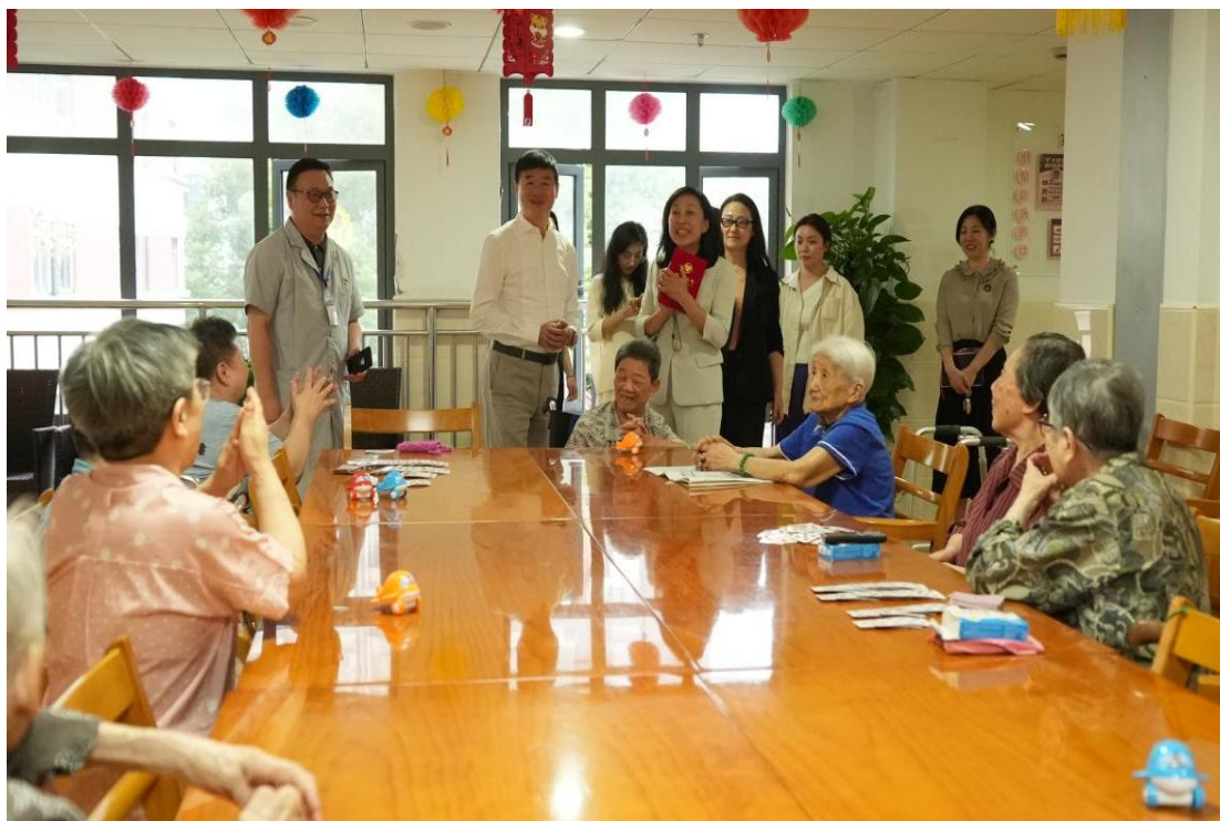
图 12 农投集团关爱长者