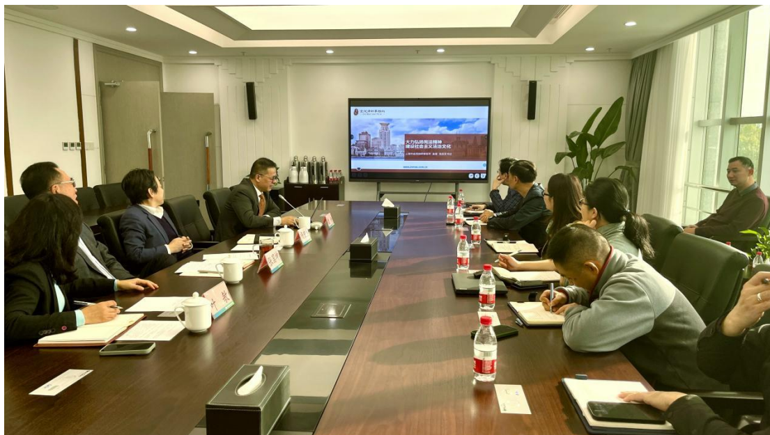
图 2 宪法宣传周专题讲座

农投集团自成立伊始就高度重视法治宣传教育，将法治文化从开创起就嵌入企业文化的建设。针对农投集团未来大量的工程设施项目建设的需要，为提高员工的廉洁自律意识，2023年9月底在集团装配式码头项目动工前，特别开展了工程领域廉政风险防范专题培训。同时，集团董事长于12月召开的集团中心组学习会议上，进行了“依法治企，规范运行，赋能高质量发展”的专题述法，并邀请集团常年法律顾问作“大力弘扬宪法精神，建设社会主义法治文化”的宪法宣传周专题讲座，充分体现了集团管理层对“依法治企、法治国企”工作的关注。