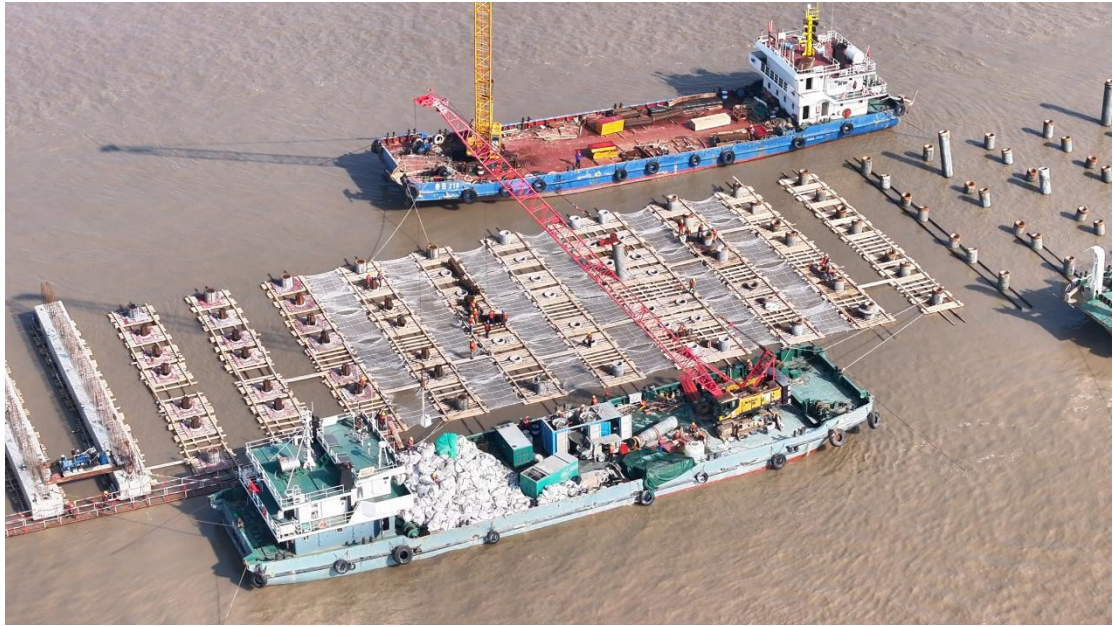
图 10 横沙新洲码头建设