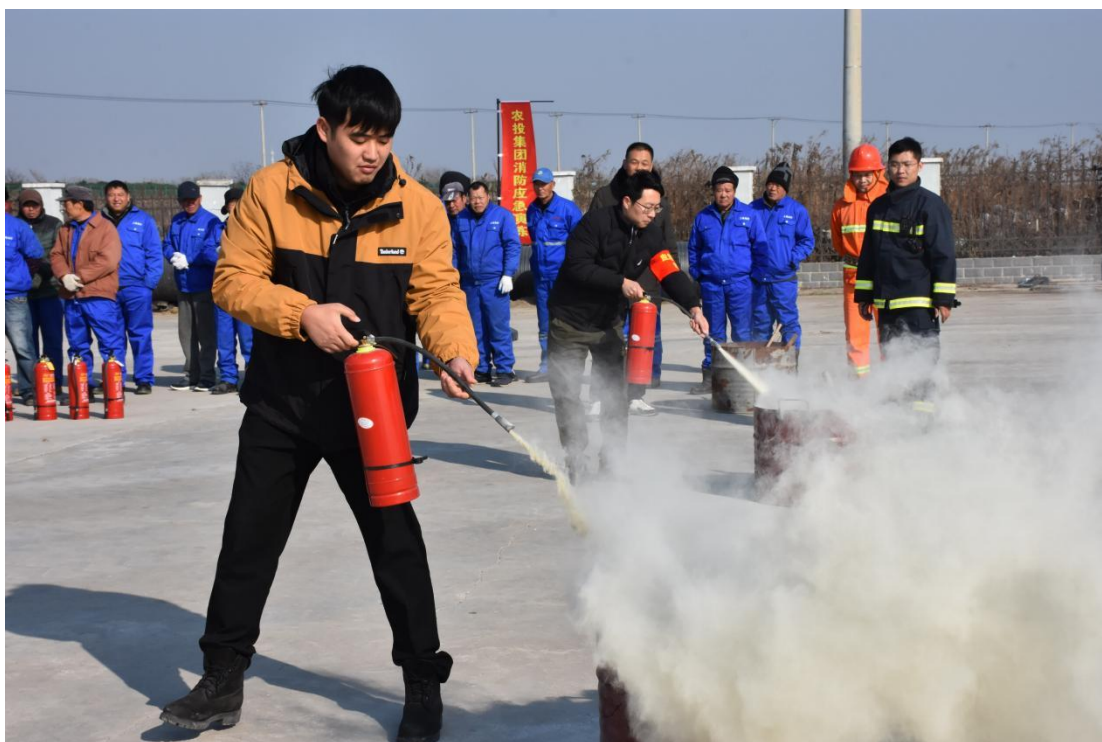
图 8 农投集团消防演习

农投集团推进安全生产建章立制。集团已制定安全生产目标管理、会议管理、资金投入管理、教育培训、建设工程管理等安全生产制度文件。确保安全生产工作有章可循、有据可查。