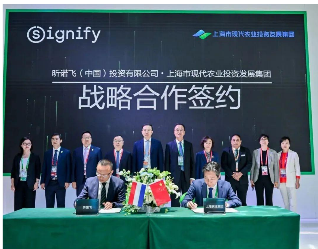
图 3 战略合作协议签约仪式

备组会议并签订了合作框架协议。项目涉及“数字农场”、“无人农场”等应用场景，推动数字农业创新，促进新一代信息技术与现代绿色农业全面深度融合。植物工厂、垂直工厂、模块化养殖等精准化农业作业，实现全生命周期智能化闭环管理和规模农业生产全程机械化。