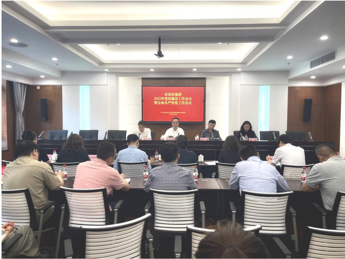
图 1 2023 年党的建设工作会议暨全面从严治党工作会议

二是顶层设计。全面落实落实“两个一以贯之”，完成农投集团和下属子公司党建入章。从集团成立初期就将党风廉政工作、内控建设内嵌入集团治理整体框架，纳入集团战略发展三年行动规划、集团创新发展规划、改革深化提升创建世界一流企业工作方案等重点规划，融入企业改革发展各领域全过程。