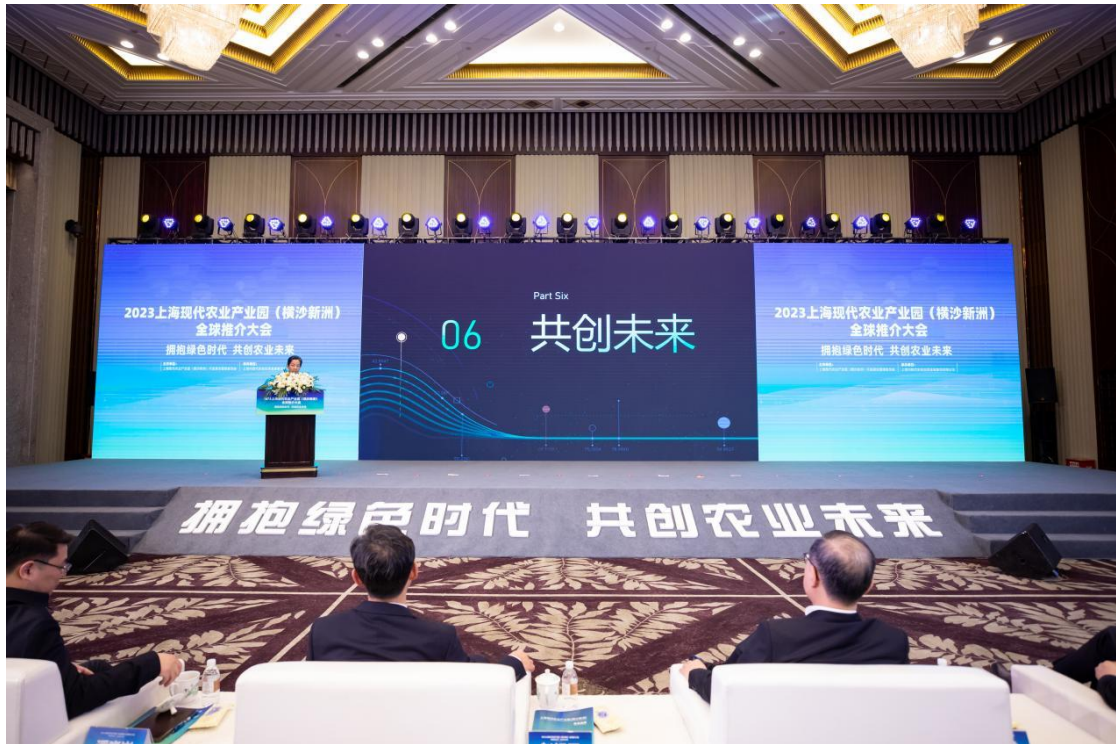
图 4 横沙新洲全球推介大会