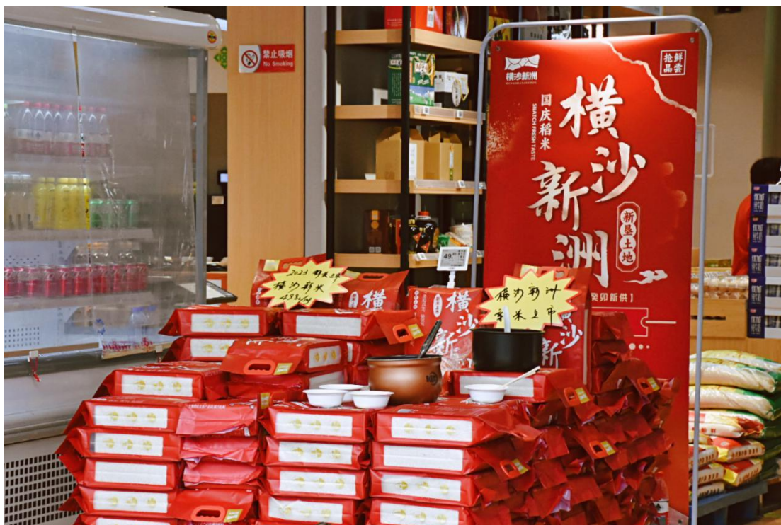
图 5 横沙新洲大米销售